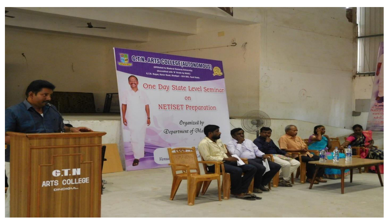
Vote of Thanks