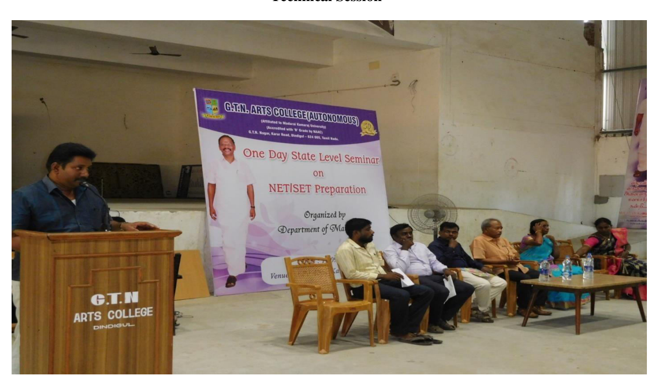
Vote of Thanks